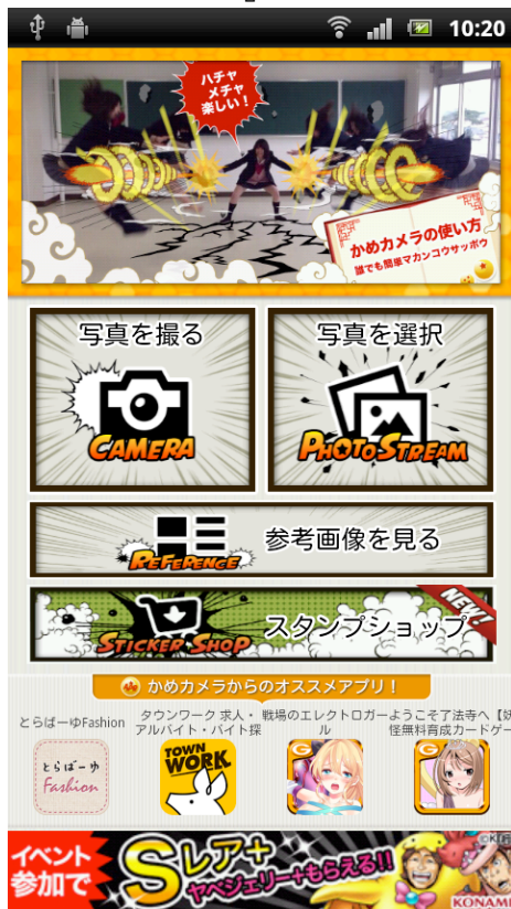
<『かめカメラ』TOPページ>