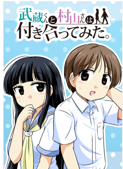
武蔵くんと村山さんは付き合ってみた。 ©なるあすく/COMICSMART INC.