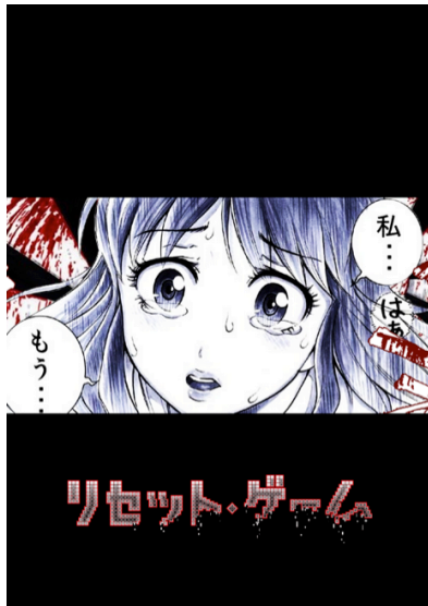
リセットゲーム ©吉開かんじ/COMICSMART INC.

コミックスmart株式会社の『GANMA!』は、2013年12月12日よりスマートフォン向けのマンガアプリ展開を開始、既にアニメ化、単行本化している作品もあるなど、オリジナル性の高い作品がユーザーから高い支持を得ています。今後もコミックスmart株式会社が提供する作品の掲載等、連携を強めていきます。