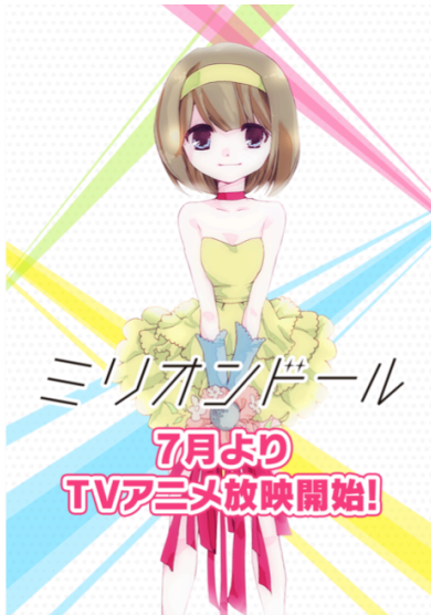
ミリオンドール ©藍/COMICSMART INC.